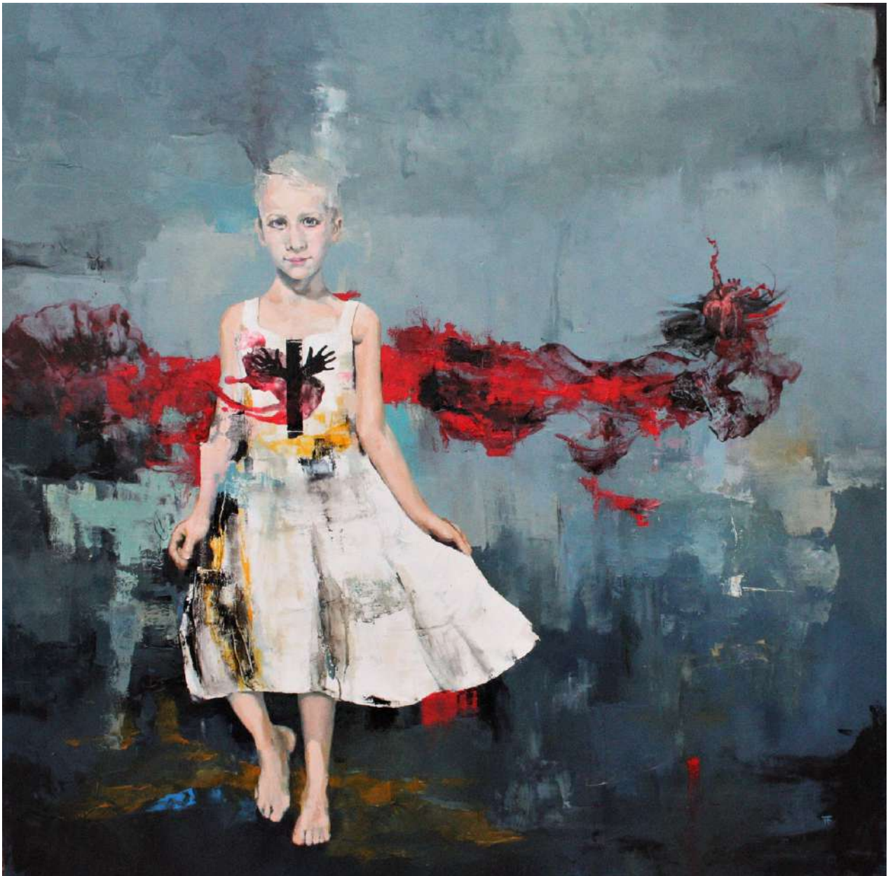
El Baile de papá. Óleo sobre lienzo. 150x150cm. 2022