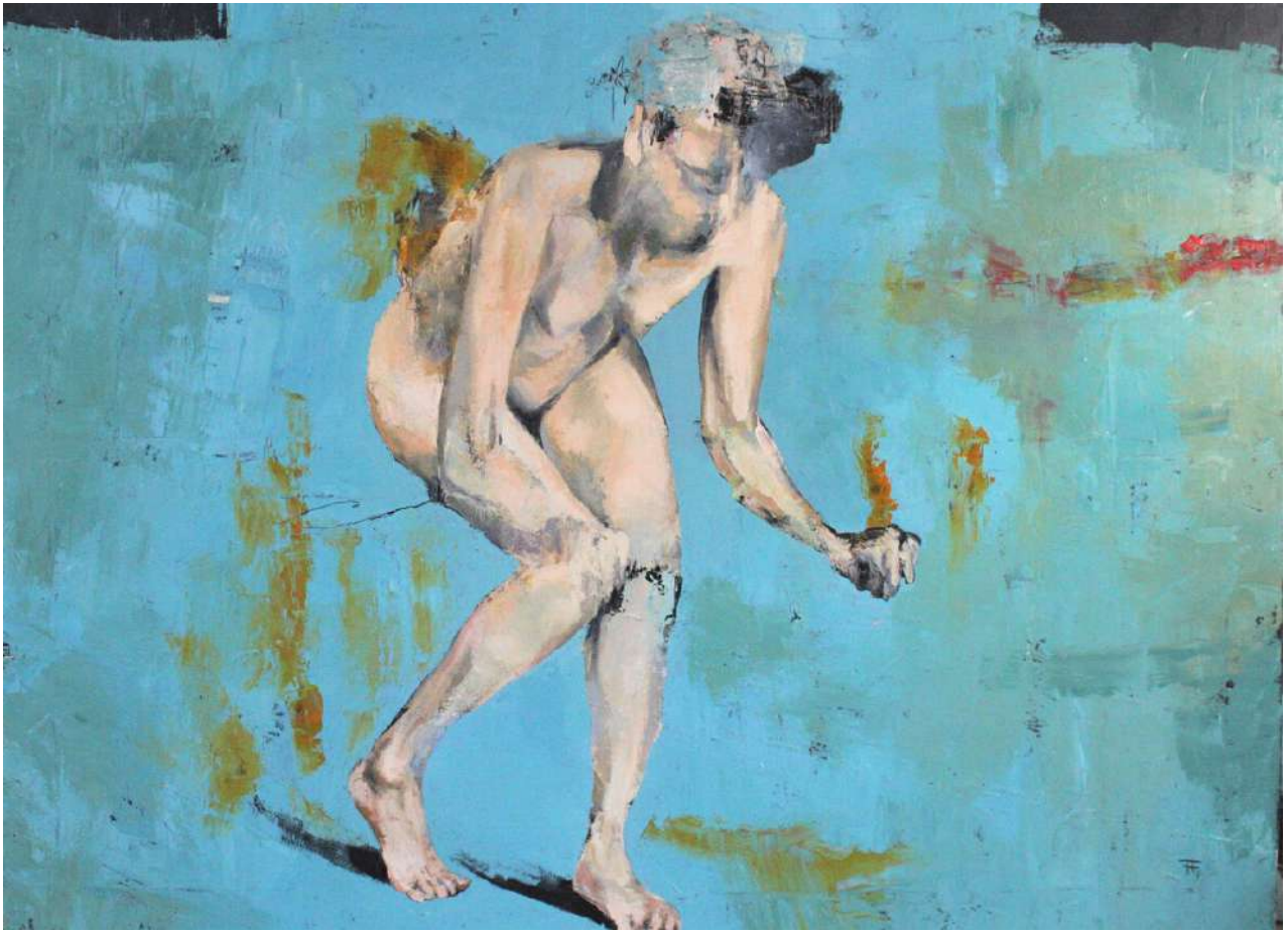
Así, rapada como tú me quieres Óleo sobre lienzo. 97x130cm. 2022