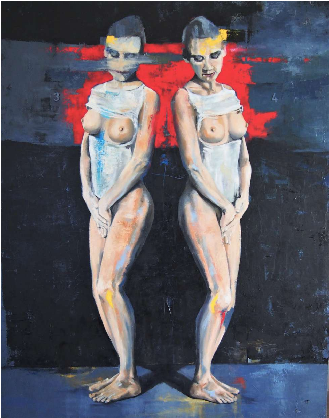
La subasta. Óleo sobre lienzo. 146x114. 2021