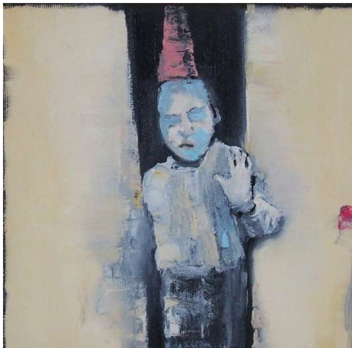
Alto! No estáis invitados