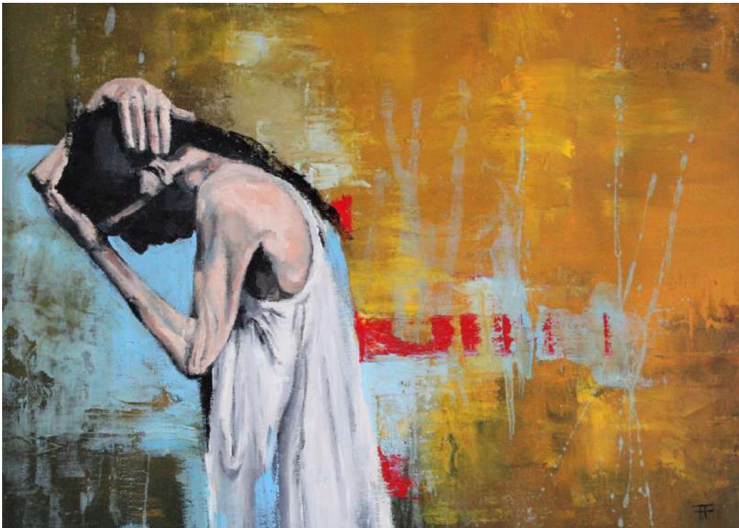
Óleo sobre lienzo. 30x40cm 2022