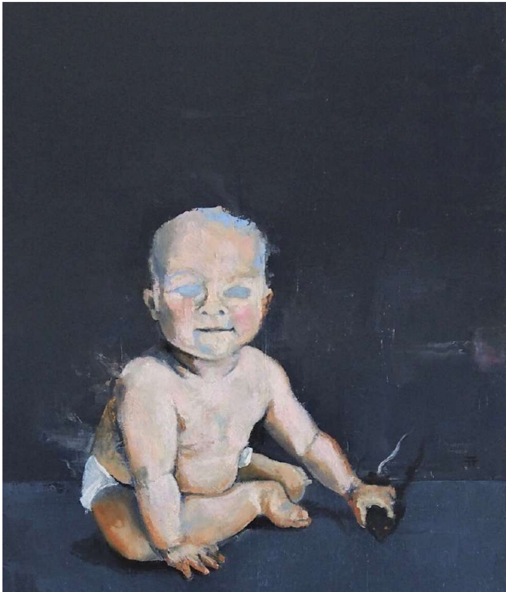
Niño con amigo. Óleo sobre lienzo. 55x46cm. 2022