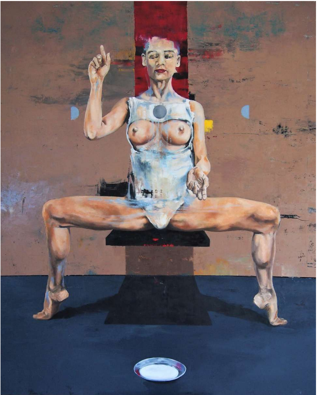
Sincretismo. Óleo sobre lienzo. 160x130cm. 2021.