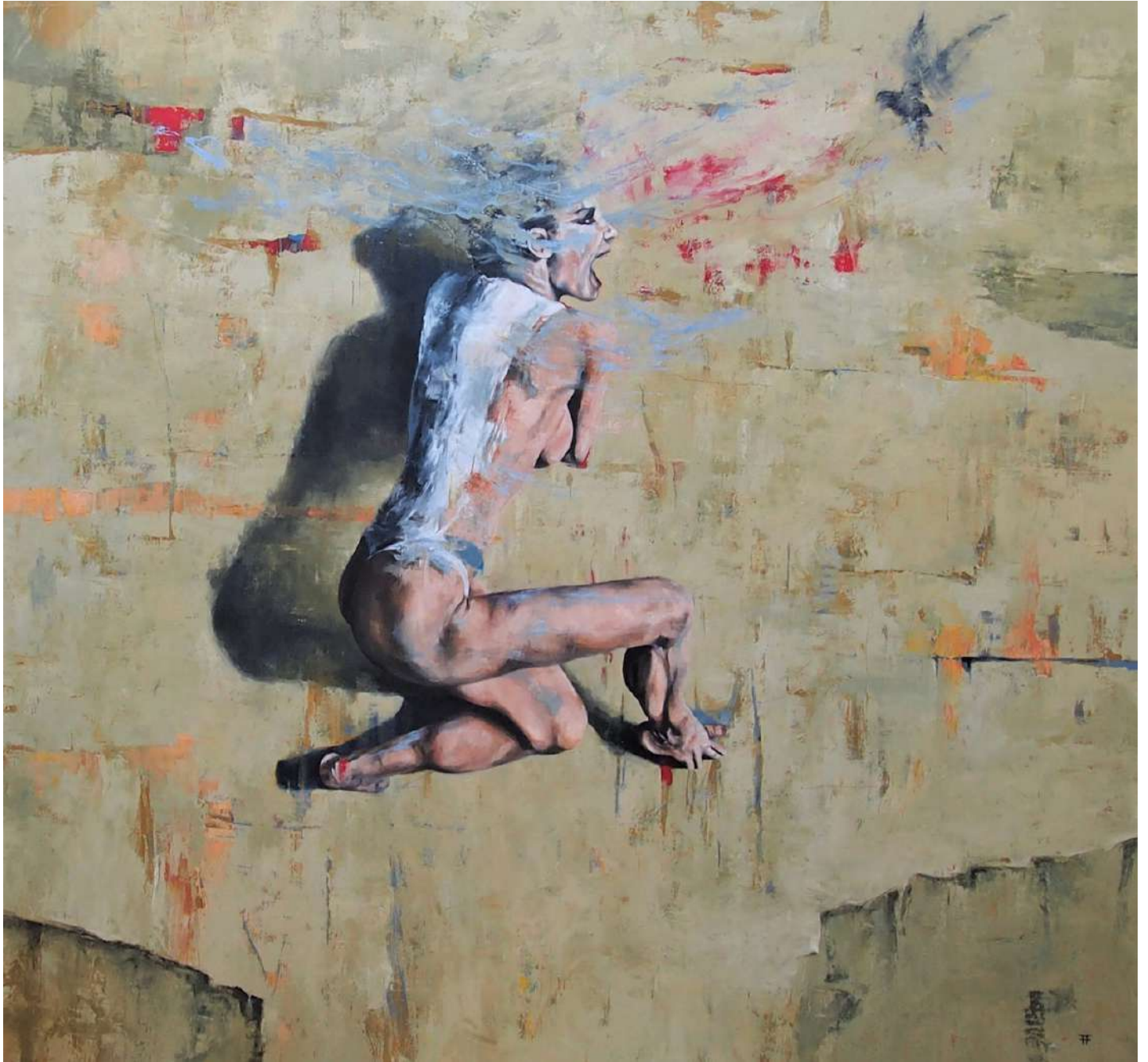
El ángel y el pájaro. Óleo sobre lienzo. 200x200cm. 2021