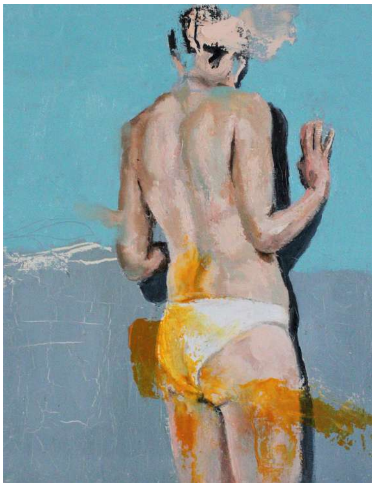
Rapada. 1 y 2 óleo sobre lienzo 24x19cm. 2022