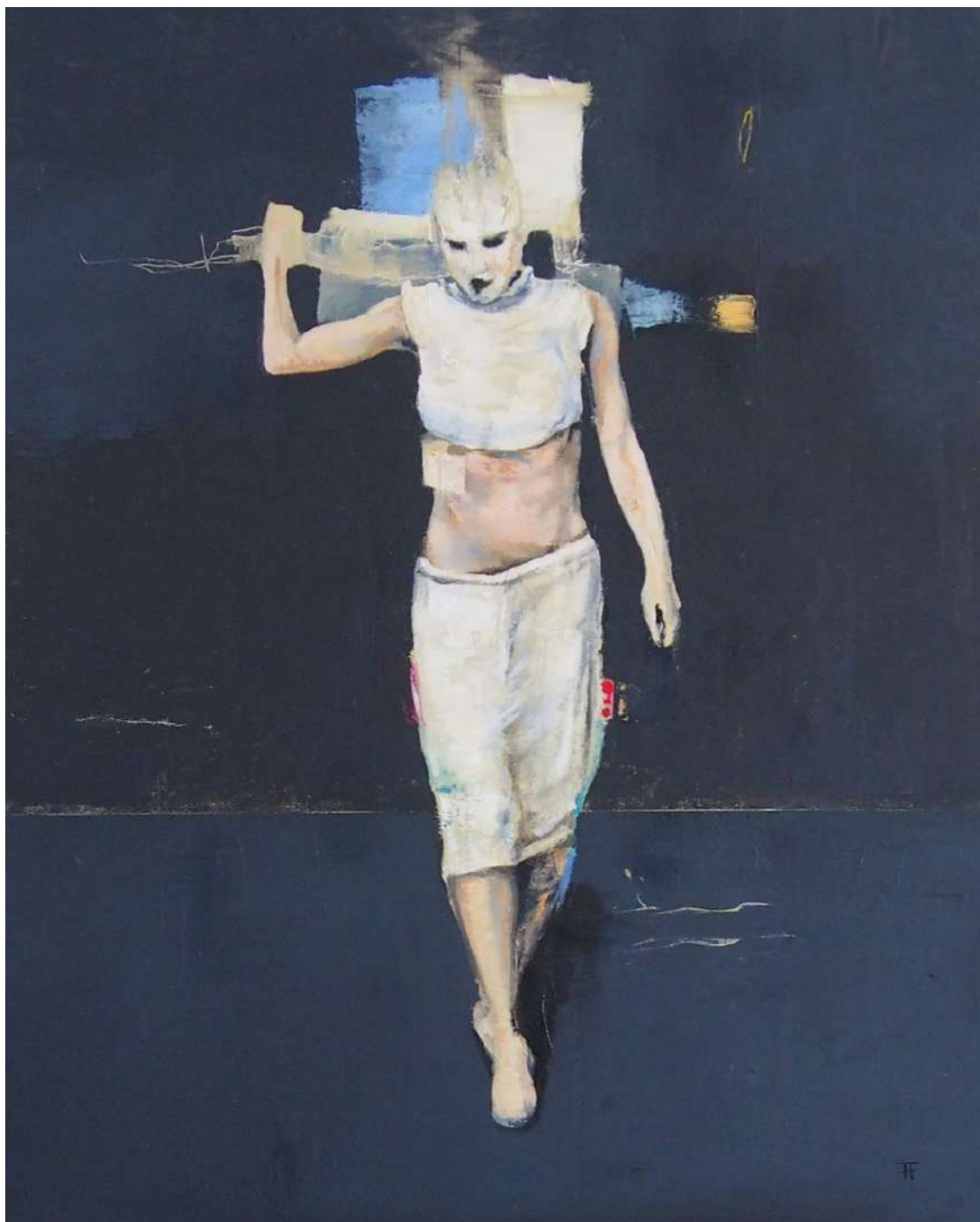
Marginal. Óleo sobre lienzo. 81x61,5 cm. 2022