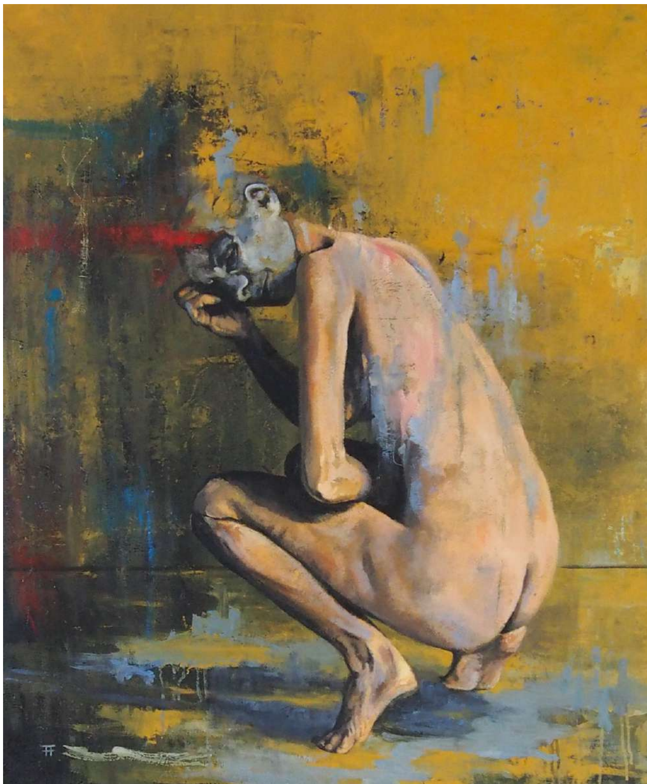
Bailando a Antonin Artaud. Óleo sobre lienzo. 100x81. 2021