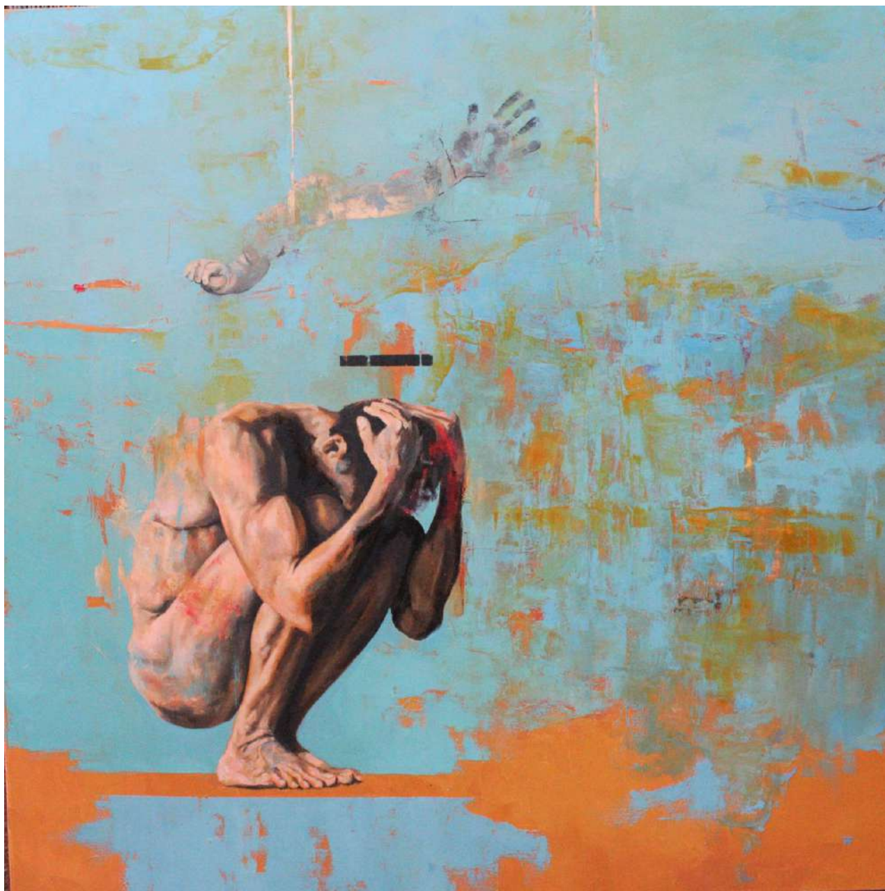
Victimario. Óleo sobre lienzo. 150x150cm. 2022