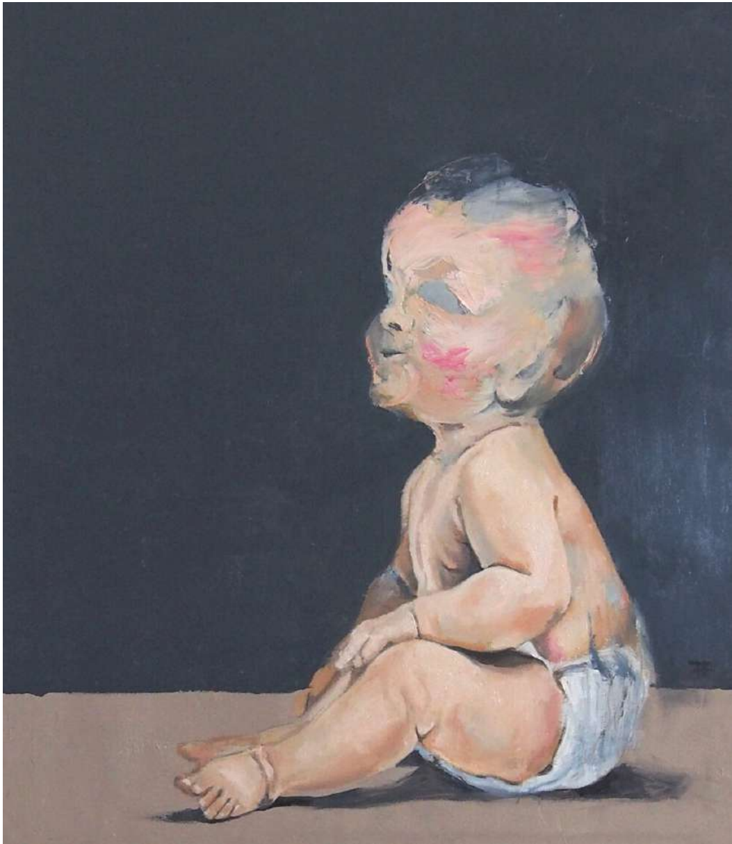
Pequeño Merrick (El hombre elefante) Óleo sobre lienzo. 55x46cm. 2022