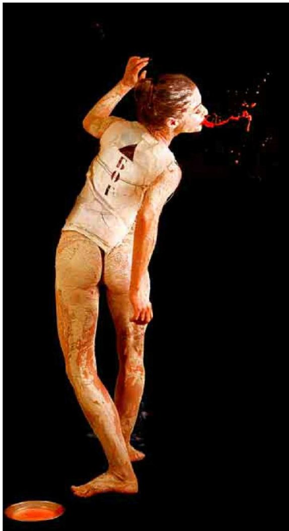
Una de las piezas de la serie 'Extranjeros en el tiempo', de ambos artistas.